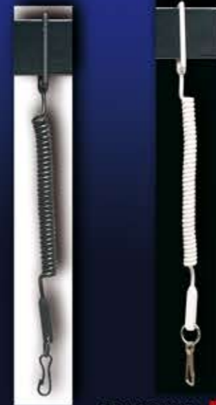
DRAGONNE - 13