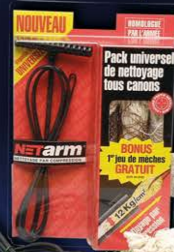
11 PACK UNIVERSEL