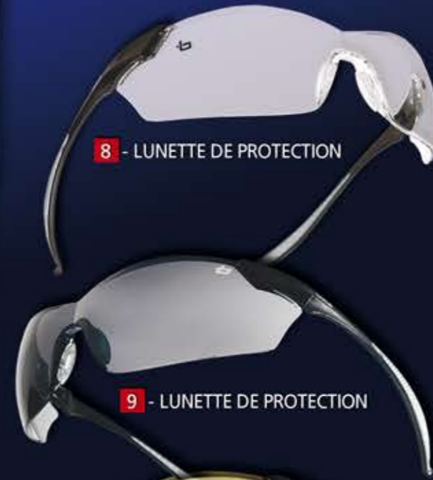
9 - LUNETTE DE PROTECTION