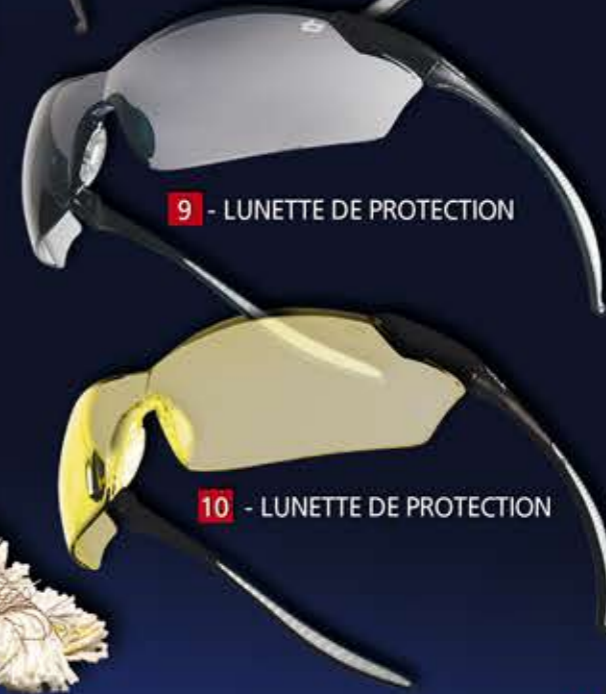
10 - LUNETTE DE PROTECTION