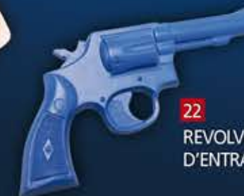
22 - REVOLVER D'ENTRAINEMENT