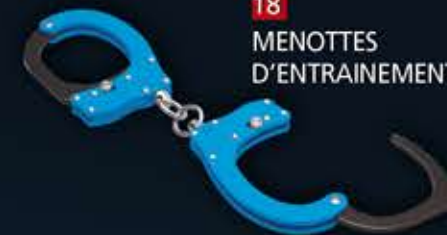
18 - MENOTTES D'ENTRAINEMENT