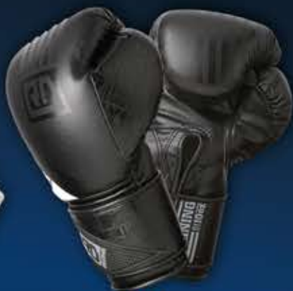
6 - GANTS DE BOXE