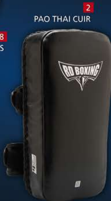
2 - PAO THAI CUIR