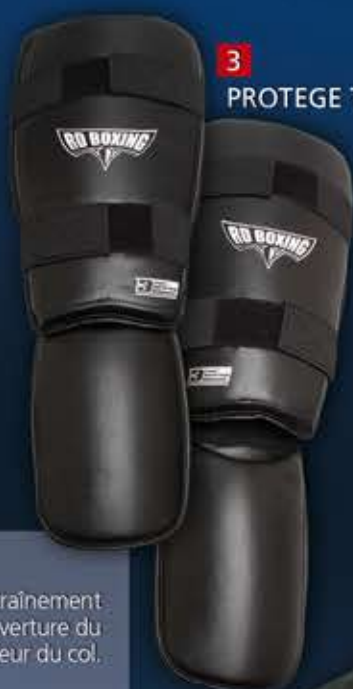
3 - PROTEGE TIBIA