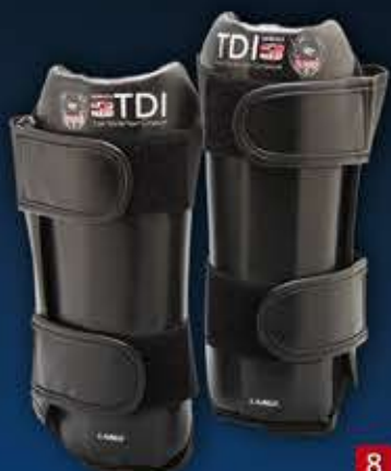
8 - PROTEGE AVANT BRAS