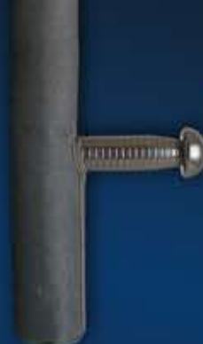
15 - TONFA D'ENTRAINEMENT