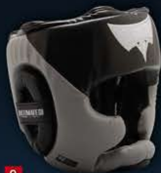
9 - CASQUE D'ENTRAINEMENT