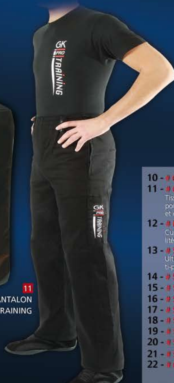
11 - PANTALON TRAINING