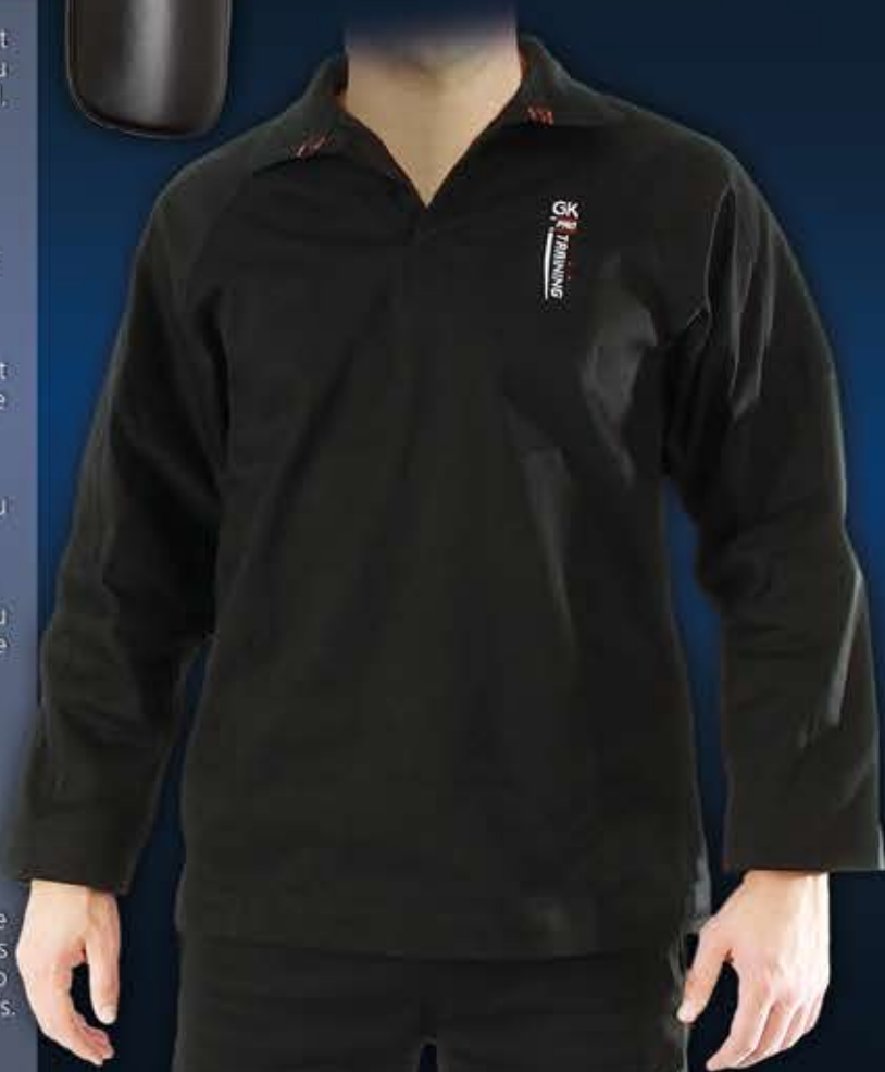
1 - CHEMISE TRAINING

Réglage "haut de tête" par lacet - Réglage "tour de tête" par large velcro - Réglage de "nuque" ergonomique par velcro - Réglage "os du rocher" par sangle velcro - Réglage "jugulaire" par double velcro capitonné - Modèle avec protection menton - Entraînements intensifs.