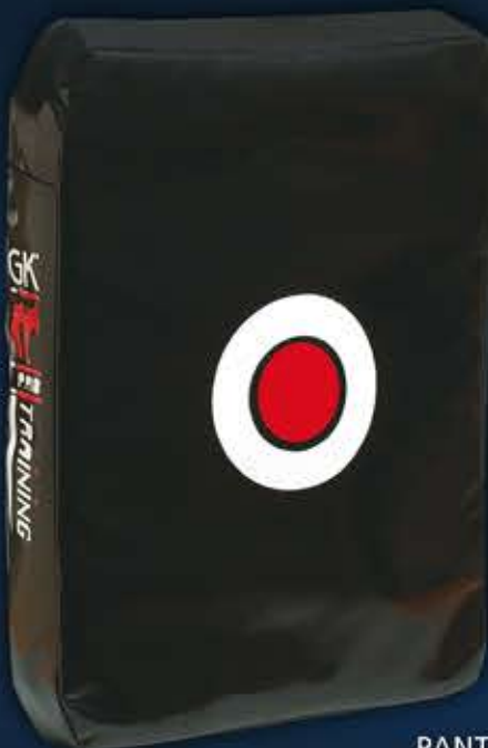
12 - G-SPEED