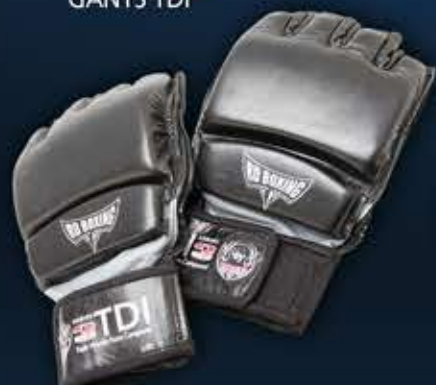
7 - GANTS TDI