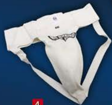
4 - SLIP COQUILLE