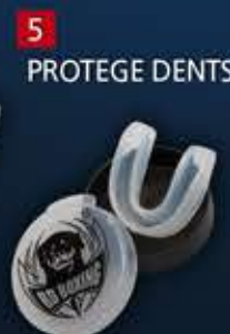
5 - PROTEGE DENTS