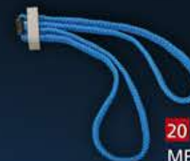
20 - MENOTTES D'ENTRAINEMENT